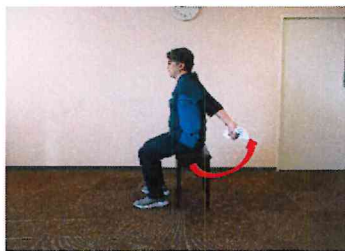
②タオルを背中から離すように動かし、肩甲骨を寄せるようにして胸をはります。