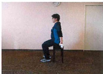
①タオルを背中に回し、両端を持ちます。

先月号に引き続き、肩甲骨の運動です。猫背を予防し、姿勢の改善に繋がりますのでぜひ試してみてください。